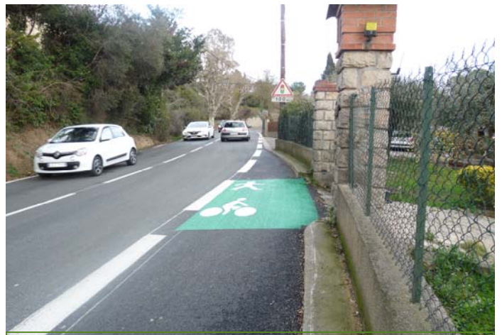
Des trottoirs et des pistes cyclables pour la sécurité de tous: une simple ligne blanche et la disparition des espaces dédiés en cours de route sont dangereuses comme ici, avenue Font Roubert.

Mougins est faiblement endettée parce que Mougins investit très peu en dehors des projets phares qui sont le pôle culturel et le cœur de vie. Le budget 2017 ne dérogera pas à la règle. Nous demandons depuis des années des investissements pour la sécurité des déplacements doux : trottoirs (une ligne blanche sur la